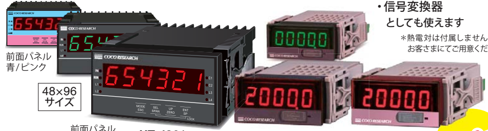
前面パネル 青/ピンク 48×96 サイズ