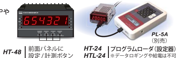
HT-48 | 前面パネルに 設定/計測ボタン