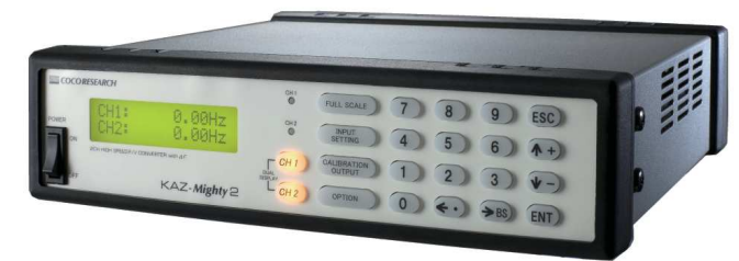
ペリオマチック™ ハイエンド機 Mighty 2